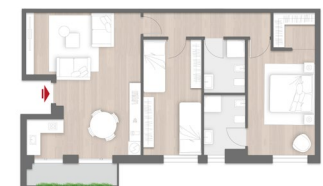
Ipotesi di layout